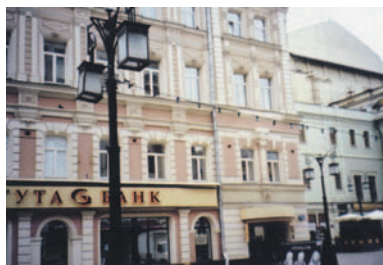
位于莫斯科市中心的一个实施项目