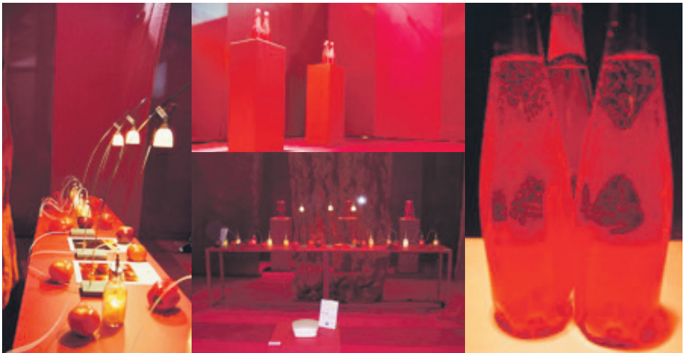
Espace rouge – Roter Raum, konzipiert und ausgeführt von Groupe Idoine, Januar 2005. Assoziationen von Licht, Material und Farbe zum Thema „Rot, Erscheinungen“